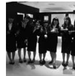
神戸女子大学 家政学部 家政学科 きまちゼミ