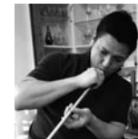
伊藤泰三 ガラス工芸作家